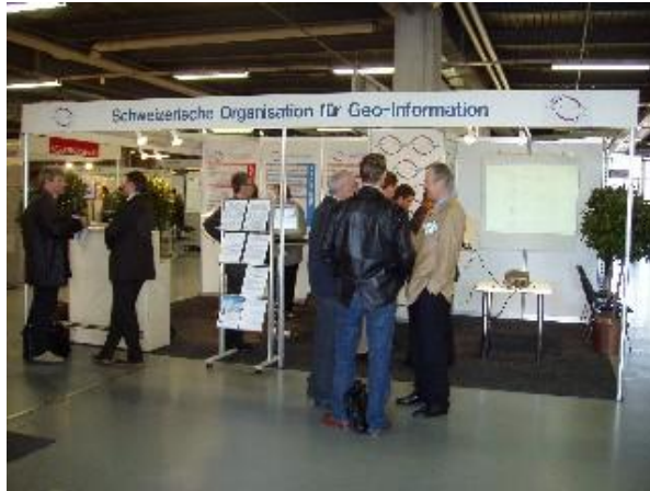
SOGI-Stand mit Präsentation des geowebforums und der Fachgruppen.

Die im Jahre 2003 durch die Kerngruppen begonnen arbeiten konnten im 2004 weitgehend abgeschlossen werden.