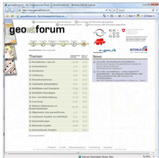
geowebforum: Startseite mit Diskussionsthemen.