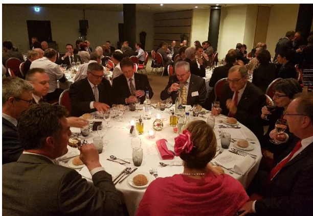
100 Jahre IGS: Bankett mit Bundesrat Guy Parmelin